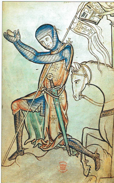
Krzyżowiec, miniatura XII w.